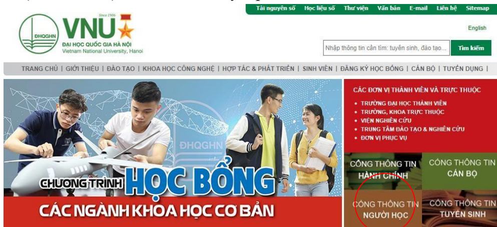
Hình 1: Vào cổng đăng ký thông tin người học qua website của ĐHQG

Để vào hệ thống, các bạn có thể trực tiếp vào địa chỉ daotao.vnu.edu.vn hoặc thông qua trang web của Đại học Quốc Gia vnu.edu.vn , tại mục Đăng ký thông tin người học (xem Hình 1) với các trình duyệt phổ biến.